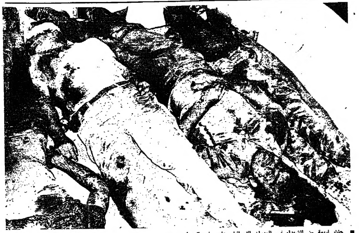
جثث أربعة من الشهداء في العدوان الإسرائيلي على مخيم البس اميس

بيروت الاربعاء ٦ آب ١٩٧٥ - السنة ١٦ - العدد ٥٢٩٥ AL - ANWAR - Beyrouth 6 Août 1975 16 e Année No. 5295